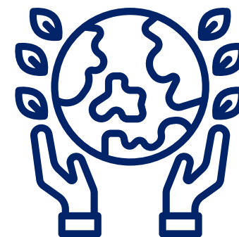
Pacto Global da ONU